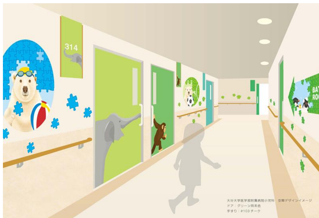
大分大学医学部附属病院小児病棟（2015年リニューアル）